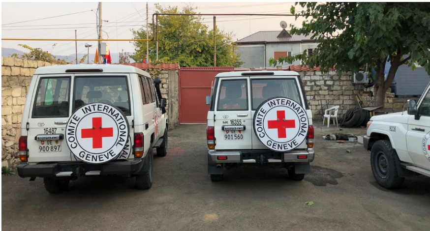
Fordon från Internationella Rödakorskommittén i Nagorno Karabach.

Både åklagaren och den tilltalade överklagade tingsrättens dom. Åklagaren yrkade att hovrätten skulle skärpa påföljden, i första hand till livstids fängelse. Den tilltalade å andra sidan vidhöll sin inställning om oskuld.