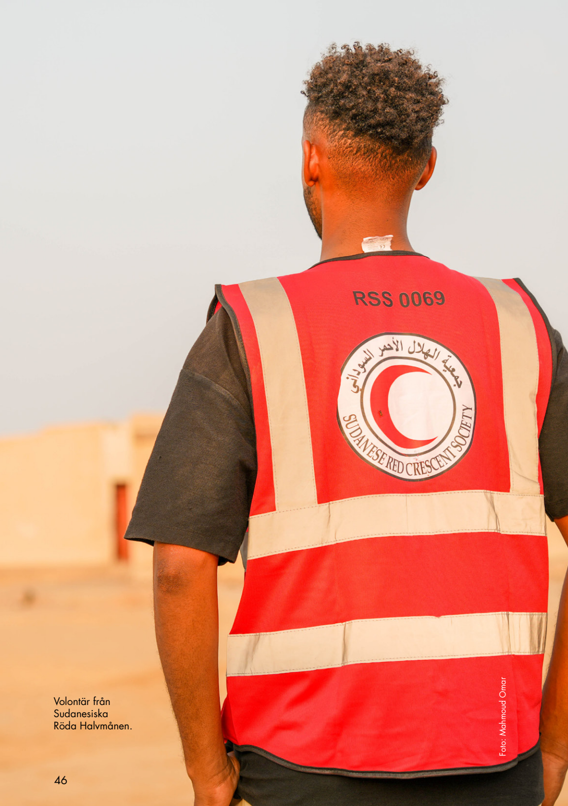
Volontär från Sudanesiska Röda Halvmånen.